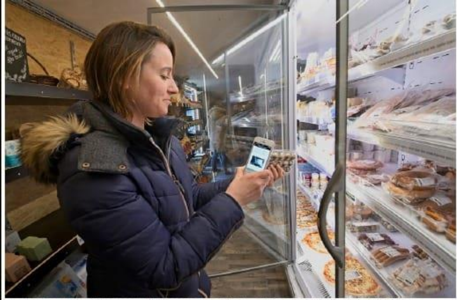
Une cliente scanne les articles avec son téléphone et paie ensuite son «panier» avec sa carte de crédit ou via Twint.

Un local rempli de produits des producteurs locaux en accès libre 24/24 et 7/7 en utilisant notre application mobile.